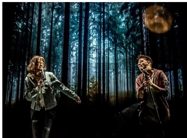
Le Scriptarium 2019.

Ce commissaire propose un univers, un thème ou une forme d'écriture que les adolescents explorent en classe. Inspirés par cette proposition artistique, plus de 1 500 adolescents prennent la plume et plongent dans ce projet d'écriture. Après une première sélection de textes en classe, les professeurs envoient les coups de cœur de leurs élèves. Un comité artistique sélectionne ensuite 24 jeunes auteurs qui sont conviés à participer à un stage de création intensif auprès de professionnels du milieu théâtral.