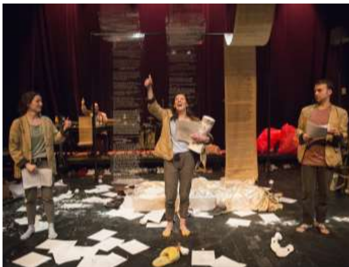
Le Scriptarium 2018.

Ce commissaire propose un univers, un thème ou une forme d'écriture que les adolescents explorent en classe. Inspirés par cette proposition artistique, plus de 1 500 adolescents prennent la plume et plongent dans ce projet d'écriture. Après une première sélection de textes en classe, les professeurs envoient les coups de cœur de leurs élèves. Un comité artistique sélectionne ensuite 24 jeunes auteurs qui sont conviés à participer à un stage de création intensif auprès de professionnels du milieu théâtral.